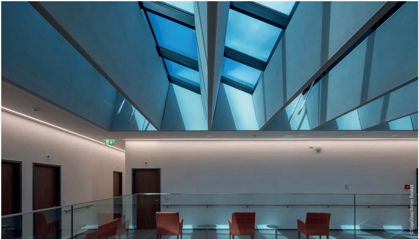
Clinique La Lignière - Gland (Suisse)