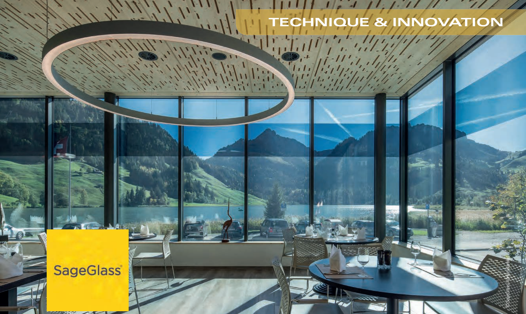
Hostellerie am Schwarzsee - Suisse