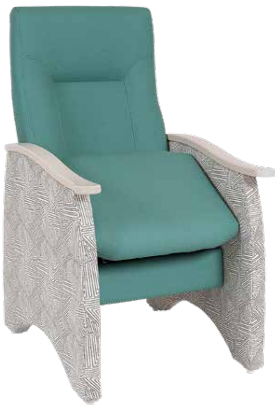
Fauteuil de repos Ergomodel Easy-Up