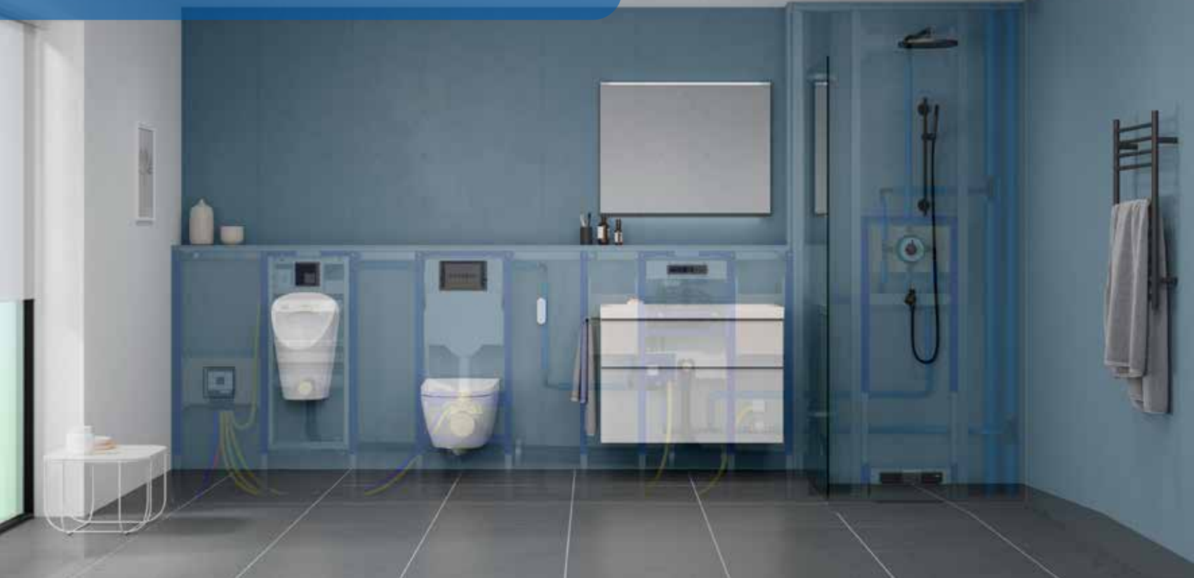
Illustration du savoir-faire Geberit derrière et devant le mur